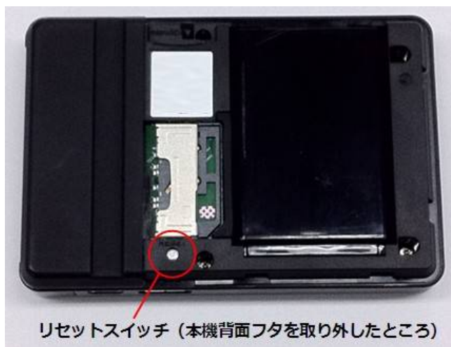
リセットスイッチ (本機背面フタを取り外したところ)

(上記ページの「Portable Wi-Fi 取扱説明書 初版」をご参照ください)