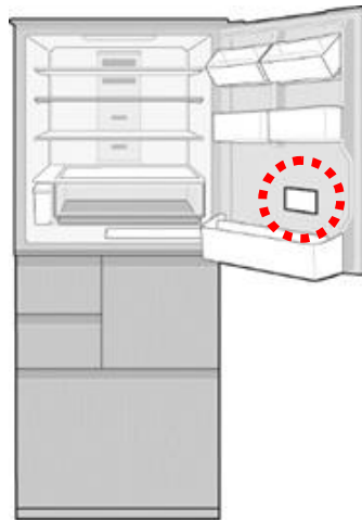
SJ-WX55D / WX50D