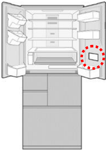
SJ-GX55D / GX50D SJ-GT50D / GT47D