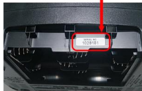
裏面 電池ふたを開けた中