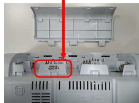
裏面 電池ふたを開けた中